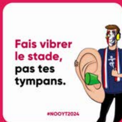
Viuels réseaux sociaux