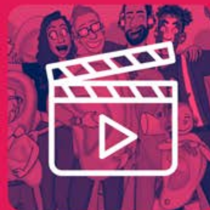
Vidéos de préventions